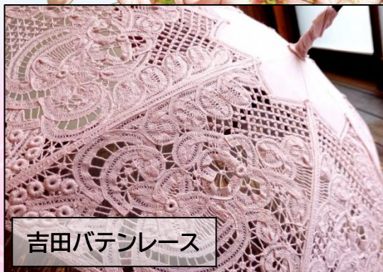
吉田バテンレース