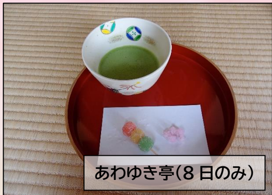
あわゆき亭(8日のみ)