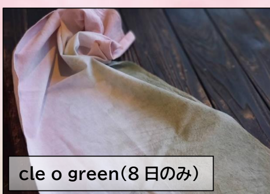
cle o green(8日のみ)